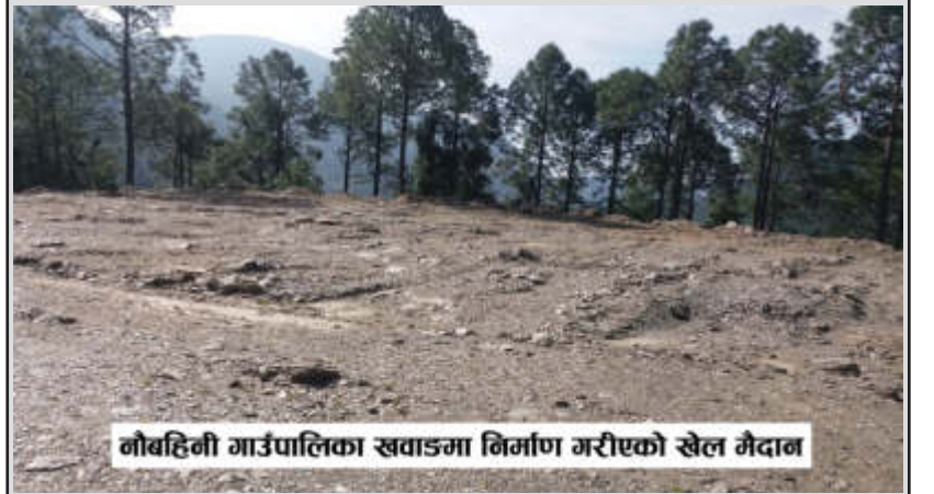
नौबहिनी गाउँपालिका खवाडमा निर्माण गरीएको खेल मैदान

प्रदेश सरकारको सहयोगमा करोडौं खर्च गरेर स्थानीय तहले निर्माण गरेका खेलकुद मैदान प्रयोगमा आएका छैनन्। खेलकुद क्षेत्रलाई दिगो रूपमा विकास गर्ने ठोस योजना भन्दा बजेट खर्च गरिहाल्ने परिपाटीतर्फ स्थानीय तहहरु लागेका कारण स्थानीय तह मार्फत निर्माण गरेका खेल मैदान प्रयोग विहीन छन्। प्रदेश सरकारले दुई वर्ष पहिले गाउँपालिकालाई ३६ लाख र नगरपालिकालाई ७५ लाख रुपैयाँका दरले मैदान निर्माण गर्न बजेट पठाएको थियो।