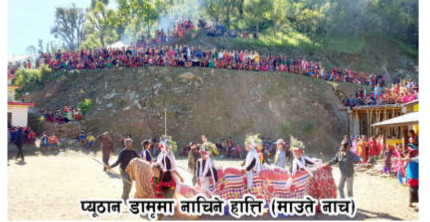
प्युठान डामूमा नाचिने हात्ति (माउते नाच)

पारेर नाचिने गरिन्छ । नाच नाच्ने समयमा पाका उमेरका गाउलेले पुरानो भाकामा गित गाउँछन् । नाचमा सिपाहीले केटा मान्छेको पहिरनमा सजिएर गितको लय र तालमा सुल्या खादै लड्ठि टेकेर काम्लो मूनी हात्ती बनेर घोटि परेर हिड्ने चेलिलाई काम्लोको अघिल्लो भागको टुप्पो छोपेर दोन्याएर नाच्दै हिड्न सुरु गर्दछन् । कोहि सिपाही भने पछिबाट खेदने र कोहि भने छेउतिर नाच्दै थाकेका फेर्ने गर्दछन् । थाकेका हात्ती असिना पसिना गर्दै बाहिर निस्कन्छन् बाहिर बसेर