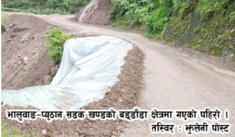
भालुवाड-प्यूठान सडक खण्डको बड्डाँडा क्षेत्रमा गएको पहिरो ।

भालुवाड-प्यूठान सडकमा सुधारको काम अलपत्र परेपछि, सर्वसाधारणले सास्ती सहनु परेको छ। वर्षौं पहिले निर्माण भएको सडक फराकिलो बनाउने काम निकै सुस्त गतीमा भइरहेको छ। यो सडकमा यात्र गर्ने पात्रुले निकै दुःख पाइरहेका छन्। सडक विग्रने गरि स्थानीय तहले सडक निर्माण गरेका छन्। स्थानीयले सडक किनारमा घडेरी निर्माण गर्ने, निर्माण सामग्री सडकमै राख्ने लगायत कारणले यो सडक दिनदिनै विग्रदै गइरहेको छ। सरोकारवाला निकायको ध्यान पुग्न सकेको छैन।