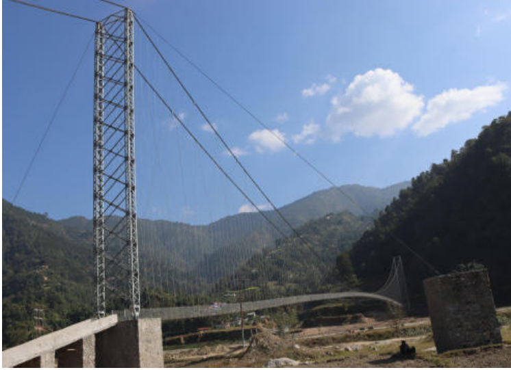
प्यूठान न.पा. ४, १० र मल्लरानी गा.पा. ४ सारीबाङमा निर्मित भोलुङ्गे पुल

पहिले प्रत्येक वर्ष वर्षायाम पछि प्यूठान नगरपालिका-१०, सारिबाङ्ग र मल्लरानी गाउँपालिका-४ सारिबाङ्गका स्थानीयहरूले काठ काटेर भ्रमरुक खोलामा फड्के पुल बनाउँदै आइरहेका थिए । यस वर्ष स्थानीयलाई फड्के बनाउन