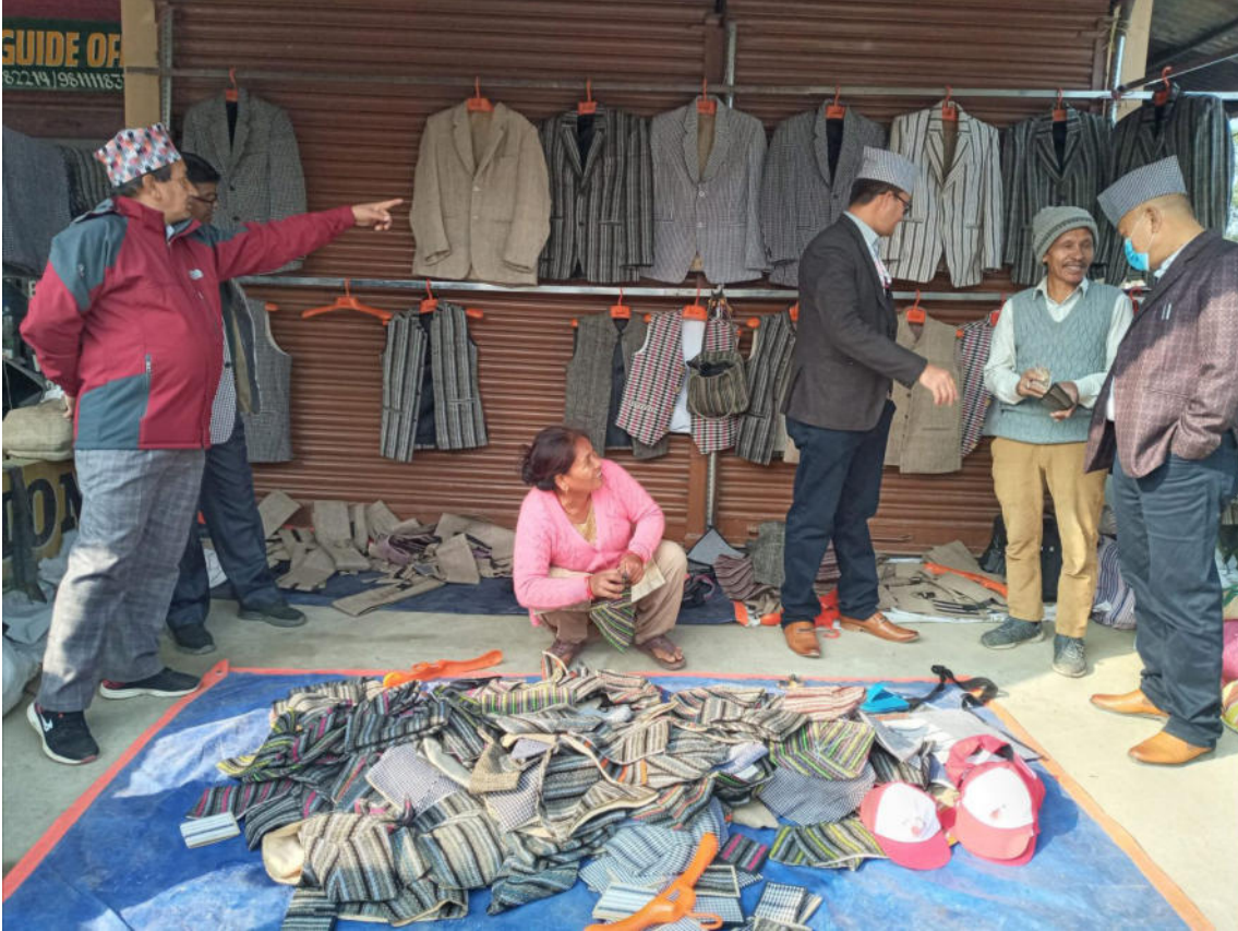
एमालेको १० औं राष्ट्रिय महाधिवेशन बन्दसत्र स्थल चितवनको सौराहामा अल्लोका कपडा प्रदर्शन तथा बिक्री