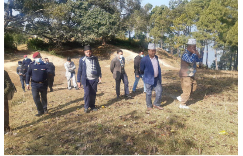
खलंगा बुढाचौरमा प्रदेश मन्त्रि सहितको टोलीद्वारा स्थलगत अवलोकन ।