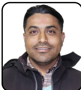
सन्देश आचार्य महासचिव