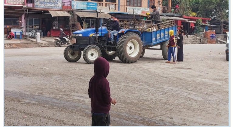
माण्डवी गाउँपालिका प्युठानले चकचके बजारमा फोहोर उठाउन पठाएको दयावट

माण्डवी गाउँपालिका प्युठानले फोहोर उठाउने काम थालेको छ । गाउँपालिकाको बजार क्षेत्रमा फोहोर उठाउन थालेको हो । गाउँपालिकाले फोहोर उठाउन थालेको करिब २ हप्ता पुगेको छ । गाउँपालिकाले आयोजना गरेको सार्वजनिक सुनुवाई कार्यक्रममा गाउँपालिका क्षेत्रका बजारवासीले बजार क्षेत्र सरसफाइका लागि सुझाव दिएका थिए । सोहि सुझाव बमोजिम कार्यान्वयन गर्ने प्रतिवद्धता बमोजिम पालिकाले सरसफाई अभियानसँगै फोहोर उठाउन थालेको हो । गाउँपालिकाको प्रयोजनका लागि खरिद गरीएको दयावटबाट पालिकाले फोहोर उठाउन थालेको हो ।