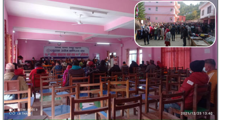
प्युठान उद्योग वाणिज्य संघको २४ औँ साधारण सभाको हल र मतदानमा हेमिष्का व्यवसायी

प्युठान उद्योग वाणिज्य संघ प्युठानको २४ औँ साधारण सभा तथा ११ औँ अधिवेशन शनिवार जिल्ला समन्वय समितिको सभाहल खल्लामा चलीरहेको थियो । हल भित्र सभा चलिरहेको थियो भने हल बाहिर मतदान । संघको पदाधिकारी चयनका लागि निर्वाचन भइरहेको थियो हल बाहिर । संघका गतिविधि प्रगति र प्रतिवेदन हलभित्र प्रस्तुत भइरहेको थियो । तर यहाँ आएका ब्यवसायीलाई हलभित्र भन्दा पनि हल बाहिर मतदानमा चासो थियो । हल खाली जस्तै देखिन्थ्यो भने मतदानमा खचाखच लाग्न थिए ।