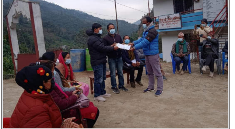
मा.वि. स्कूल सञ्चालनमा सहयोग गर्न अनुरोध पत्र गाउँपालिका अध्यक्षलाई हस्तान्तरण गर्ने