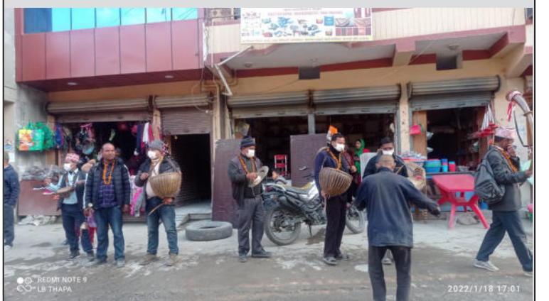
प्यूठान न.पा. ४ विजुवारमा दुलहि लिन जाँदै गरेका पञ्चेबाजा सहितको जन्ति टोली

विवाह, पर्व, मेला र उत्सवमा पञ्चेबाजा बजाउने चलन पछिल्लो समय लोप हुँदै गएका छन् । गाउँमा पञ्चेबाजा बजाउँदै गरीने विवाहको रौनकता बेल्ने हुन्थ्यो । बाजा ताल धेरैलाइ मन पर्ने परम्परागत धुन हो । चौरासी पुजा र विवाहमा बजाउने सनाई, थोकुडी, टेम्कुली, भ्यूयाली र बाजा तालमा कम्मर ढल्काए खुवे नचरी लाग्थ्यो । आजभोली भने परम्परागत बाजा ताल लोप हुँदै गएको छ । विवाह र उत्सवमा डेक बजाएर नाँच्ने प्रचलन बढेको छ । होटेल, रेष्टुरन्ट र पार्टी प्यालेसमा विवाह गर्ने प्रचलन बढेको हो । गाउँबाट विवाह गर्नका लागि युवा युवतीहरू बजारका खुलेका पार्टी प्यालेसमा भर्ने क्रम बढ्दो छ । पञ्चेबाजा बजाउनेहरूको गुजारा चलन छोडेपछि उनीहरू बैकल्पिक पेशा खोज्न बाध्य छन्। यो सँगै परम्परागत पञ्चेबाजा र मौलिकता पनि लोप हुन थालेको हो । साउण्ड सिस्टम र डेक बजाएर नाँच्ने चलन भन्ने बढेको छ । नयाँ युवा पुस्तामा देखासिकीमा विवाह गर्ने चलन बढ्दा गाउँघरमा परम्परागत विहे गर्न छोडेका हुन् । युवा पुस्ताले परम्परागत बाजा बजाउन छोड्नु र आधुनिकतासँगै रेडिमेट गितको प्रयोग बढ्नाले मौलिकता हराएको हो ।