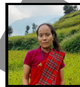
लक्ष्मी मगर संघर्ष

आज एक्लो हुनुमा दोष कसलाई दिउँ सै, न त तिम्रो दोष छ न मेरो समय उस्तै भयो ।