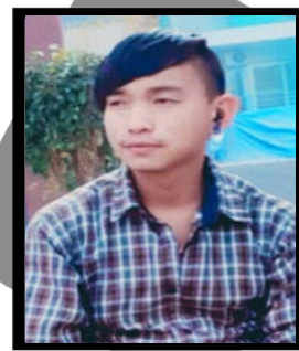
प्रकाश समर्पण मगर

सुकुरी दिघर अनि धार दिघर । गाएको छ मलाई कोहि उपहार दिघर । हेर्नुस न उसको सर्त पनि कस्ता कस्ता रे, जैले संसार छोडनु पर्ने जस्ता रे