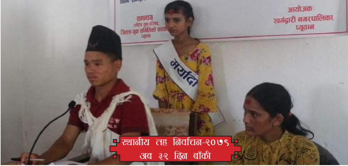
स्थानीय तह निर्वाचन-२०७९ अब ३२ दिन बाँकी