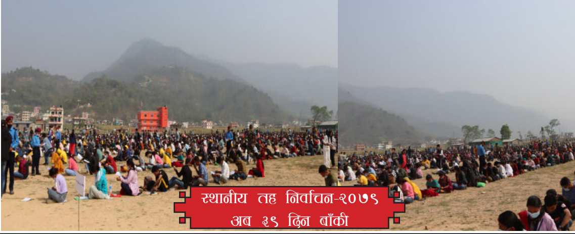
स्थानीय तह निवचन-२०७९ अब ३९ दिन बाँकी