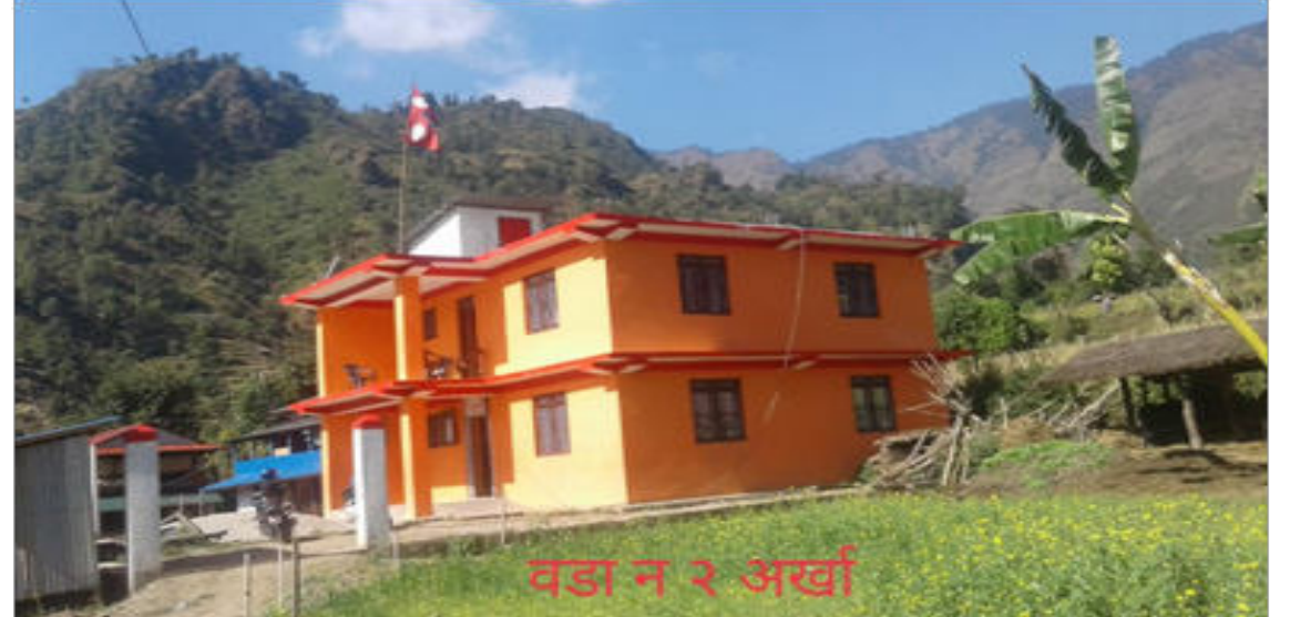
वडा न २ अर्खा

-गाउँपालिकामा एउटा सभाहल निर्माण सम्पन्न गरिएको छ।