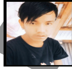
खगिन रिदम लामा खोटाङ इन्ट्रेपी पोखरी

मुक्तक १ प्रत्येक पलपलमा सताउने तिम्रै चादले हो । मध्य रातमा सधैर ब्युक्तउने तिम्रै चादले हो । स्वासे बन्द हुने गरेर मलाई उन्माद तुल्चापर, निश्चल यो मनलाई बहकाउने तिम्रै चादले हो । मुक्तक २ घुग्दो मित्र थोरे तिमि लजाएको कसरी हेरौँ । तिम्रो मुहार मरी उमङ्ग खाएको कसरी हेरौँ । निस्तौ पठाएकी छी मेरो बिहेमा आउनु मनी, परार्थले तिम्रो सिउँदो रङ्गाएको कसरी हेरौँ । मुक्तक ३ अतीत सकिम भावको जाहिराईमा डुबेर उदासिन्छ यो मन । कल्पनातै मधुपनि त्यो क्षितिजमा पुगेर उदासिन्छ यो मन । आफुभित्र आफै हरापर केही समज अतीत सकिम बस्ता, थाहै नपार्छ आश्रुधारा मारी कतिसेर उदासिन्छ यो मन ।