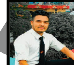
कमल रोक्या नोबहिनी गा.पा.-५ गार्दै, प्यूठान

गजल : भोट भोट लाग्न आधमा सुकेको वारी देखाउनु । दुन्दकालमा फुट्टेको पुरा र सेतो सारी देखाउनु । विकास भन्ने हो भने ढुङ्गो युग जस्तै छ, कोरोना विश्व मरी फैलिइएको महामारी चुनाउनु । एक दिनको छक टारे अर्को बिहानलाई केथो? वर्षौ देखि स्थितिभको अन्नको मकारी देखाउनु । दुन्दकालमा हराएको छोरको थाहा पतो छैन, उसैको फोटो सहितको धिनारी देखाउनु । कुन व्यावस्था फेरियो र उस्तै छ अवस्था, विकासको नाममा गरिया दाइको पिठ्युँको मारी देखाउनु । प्रकृति अहिले सगम हरियाली मण्डको खोडै? जतातै फैलिइएको बनमारको मकारी देखाउनु ।