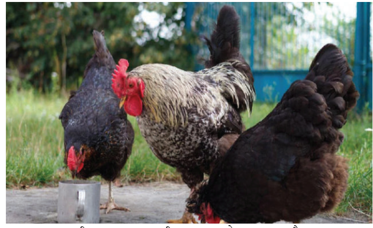
अण्डामा व्यवसायिक रुपबाट उत्पादित

घरमा पालेको कुखुराले पारेको अण्डा र आफ्नै खेतबारीमा उब्जाएको सागसब्जी भन्दा ताजा सायद अरु केही हुँदैन । अष्ट्रेलियामा करीब ४ लाख मानिसहरुले आफ्नो घरमै कुखुरा पाल्दछन् । नेपालमा पनि ग्रामीण क्षेत्रमा अधिकांश परिवारहरुले घरमा कुखुरा पाल्ने गरेको पाइन्छ । घरमै कुखुरा पालेका मानिसहरुले ताजा अण्डा खान पाउँछन् । तर, वैज्ञानिकहरुका अनुसार अण्डाको हकमा केवल ताजा हुनु मात्रै पर्याप्त हुँदैन ।