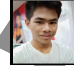
पि.आर. मगर प्यूठान नगरपालिका -५ जुलीकाँडा प्यूठान सायद नेताहरुलाई थाहै छैन, जब दिग्को/जोरिएको, बाचा पुरा हुँदैन, समाज र मानव जीवन माथि विश्वासघातको खेल खेल्नुन्छ, तब चुवाहरु नयाँ श्रावित सुरु गर्न सक्छन् ।

कविता : गाउँमा एकता छैन जुन दिन, नेताहरु जाउँ पसेर जनता माग्नै मनको बिउ छर्दै हिँडे । त्यस दिन देखि गाउँमा एकता छैन । नम्रको कुरालाई, मध जस्तो गरी/मनि, जुन दिन जनताको मनमा बलियो जग बसाले, त्यस दिन देखि समाजमा शान्ति, घरमा एकता, मान्छेमा मानवता छैन । जुन दिन, नेताले सबैलाई सुई मान्छे उचाल्न उसको आँसलाई अधुरो सपना देखाए, त्यस दिन देखि चुवाको आँसुमा शान्ति को निद्रा छैन । सायद नेताहरुलाई थाहै छैन । जब मम चर्थाथमा परिणत हुँदैन, तब बम मधर बिस्फोट हुनसक्छ ।