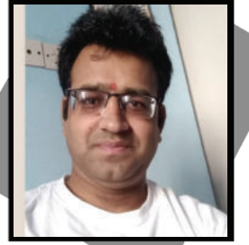
डा. मुकुन्द भा

तपाईंको पोषक तत्वहरू राख्नाले तपाईंलाई रक्तस्त्राव र क्षय जस्ता लक्षणहरूबाट बचाउन सक्छ। यदि तपाईंलाई ब्रेसिसको बारेमा चिन्ता छ भने अर्थोडोन्टिस्टले पारस्परिक ब्रेसिसका विभिन्न विकल्पहरूको बारेमा तपाईंसँग कुरा गर्न सक्छ। तपाईंलाई चासो लाने एउटा विकल्प भनेको इन्भिजेलिड विकल्प हो। इन्भिजेलिड एक प्रणाली हो जसले परम्परागत कोष्ठकहरूको सट्टा दाँत सीधा गर्न प्लास्टिक एलिमेन्स प्रयोग गर्दछ। यदि तपाईं गर्भवती हुँदा तपाईंको दाँत सीधा गर्ने बारे विवेकी हुन चाहनुहुन्छ भने, तपाईं अर्थोडोन्टिस्टलाई इन्भिजेलिड बारे